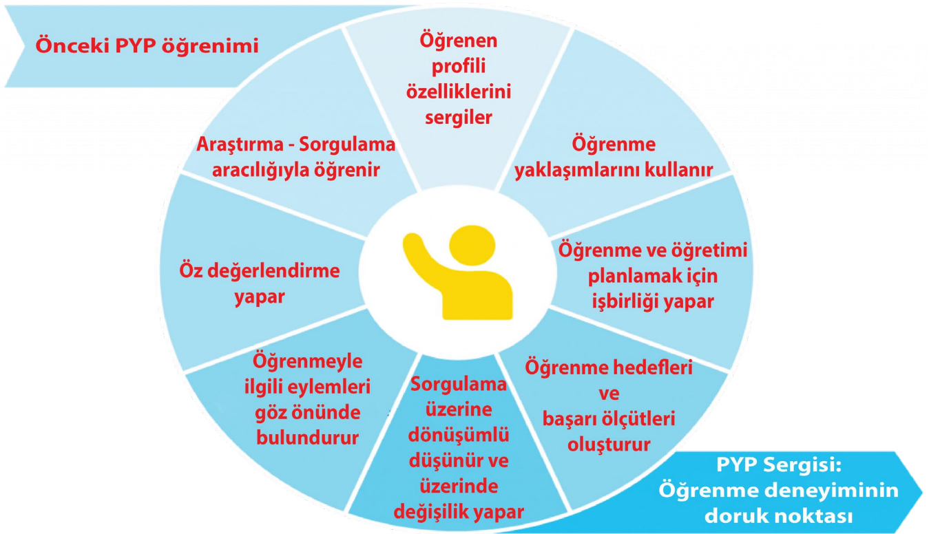
Şekil 1. PYP Sergisi