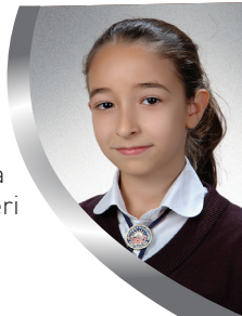
Naz ÖlÇAL 7/D

26 Nisan 1920 sabahı şehrin doğu kısmını kuşatan Albay Normand birlikleri Mağarabaşı semtini aralıksız bombalarken, aynı anda iki tankın desteği altında 400 kişilik bir Fransız kuvveti Nizip yolu üzerinden şehrin doğu cephesine taarruz başlattı. Küçük çaplı top ve makineli tüfeklerle donatılmış tanklar, Türk siperlerine en yakın mesafelere kadar sokularak ateşe başlayıp piyadelerin ilerlemesini sağlamışlardı. Ancak tanklarından biri arızalanan ve fazla ilerleyemeyeceklerini anlayan Fransızlar, daha fazla kayıp vermemek için geri çekildiler.