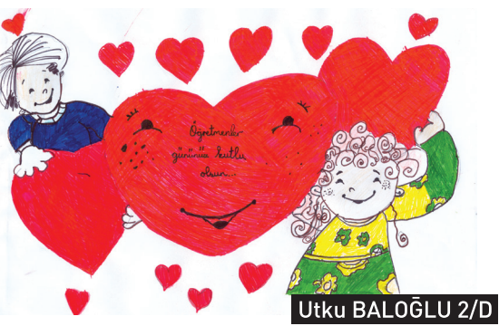
Utku BALOĞLU 2/D

Hayvanlar da bizim gibi haklara sahiptir. Her hayvanın yaşama hakkı vardır. O yüzden hayvanlara zarar vermemeliyiz. Onları sevmeli ve korumalıyız. Onların ulaşabileceği yerlere su ve yiyecek koymalıyız. Çünkü onlar da bizler gibi beslenmek ve su içmek zorundadır. Onlara zarar vermek kendimize zarar vermektir. Çünkü doğadaki her canlının görevi vardır. Bir canlıya zarar verirsek doğal denge bozulur. Biz de zarar görürüz. Bunları iyi bilip onları sevmeli ve korumalıyız.