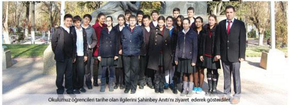
Okulumuz öğrencileri tarihe olan ilgilerini Şahinbey Anıtı'nı ziyaret ederek gösterdiler.

Kurşunları bitince tüfeğini yere atarak düşmana karşı yumruk larını sıkarak ayakta dumuş tur. Öldürülmeyi beklercesine düşman askerlerinin karşısın da durur. Şahin Bey'in yanı na yaklaşamayan askerleri ona uzaktan ateş ederek 28 Mart 1920 'de Şahin Bey'i orada şehit eder ler. Şahin Bey'in son sözü ise: "Allah'ım vatanımı kur tar, alçak düş man! Gel sen de süngü le." olmuş tur.