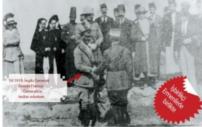
Yıl 1919, İngiliz General Antep'i Fransız Generaline teslim ederken

olan Türk bayrağının indirilerek, Fransız bayraklarının çekilmesini tedi. Ayrıca Türk polis ve jandarmasının Fransız makamlara bağlanması talep etti. Hiçbir zaman tatbik edilmeyen bu emirler Türkler üzerinde müthiş etkiler yarattı, Fransızların bu davranışlarına paralel olarak Ermeni askerlerle işbirliği yapan yerli Ermeniler de Türk halkına karşı zulme, hakarete, dövüp sövmeye, yalnız buldukları yerde akla gelmedik işkencelerle öldürmeye başladılar. Türkler Ermenilerin çoğunlukta oldukları semtlerde dolaşamazlardı. Tecavüzler, sarkıntılıklar Türk kadın ve kızlarına kadar yansıdı. Bir akşamüzeri şimdiki Şehit Kamil Okulu önünden geçen bir Türk hanımına, sarhoş Fransız erleri sarkıntılık ettiler. Annesine yapılan te